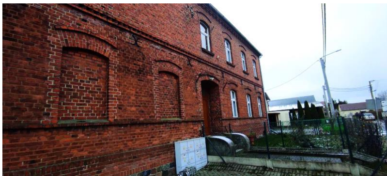
Dawna szkoła (częściowo sala wiejska)