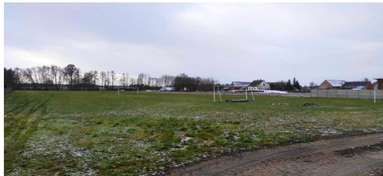
Teren za budynkiem sali z boiskiem trawiastym